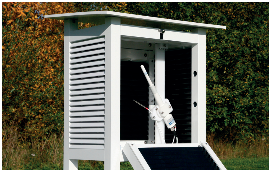
Sonda HMP155 con estable sensor HUMICAP®180R y una sonda adicional de temperatura.